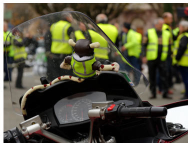
Photo : Thomas Bresson, Gilets Jaunes à Belfort le 17 novembre 2018, CC 4.0 BY,

🔗 https://atlas-social-de-france.fr/index.php?id=996