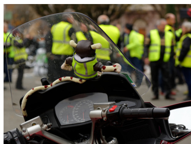
Gilets Jaunes à Belfort le 17 novembre 2018